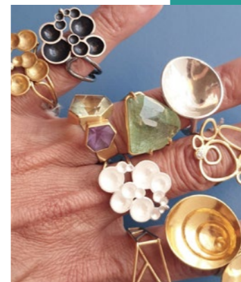
KARENFLY STRANDFUND MEDALJON