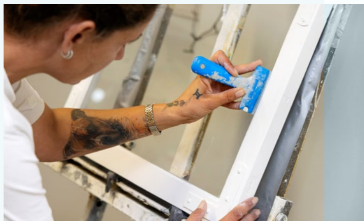
Når rammerne er afrenset og gennemgået af snedkeren bliver de grundet og malet med linolie